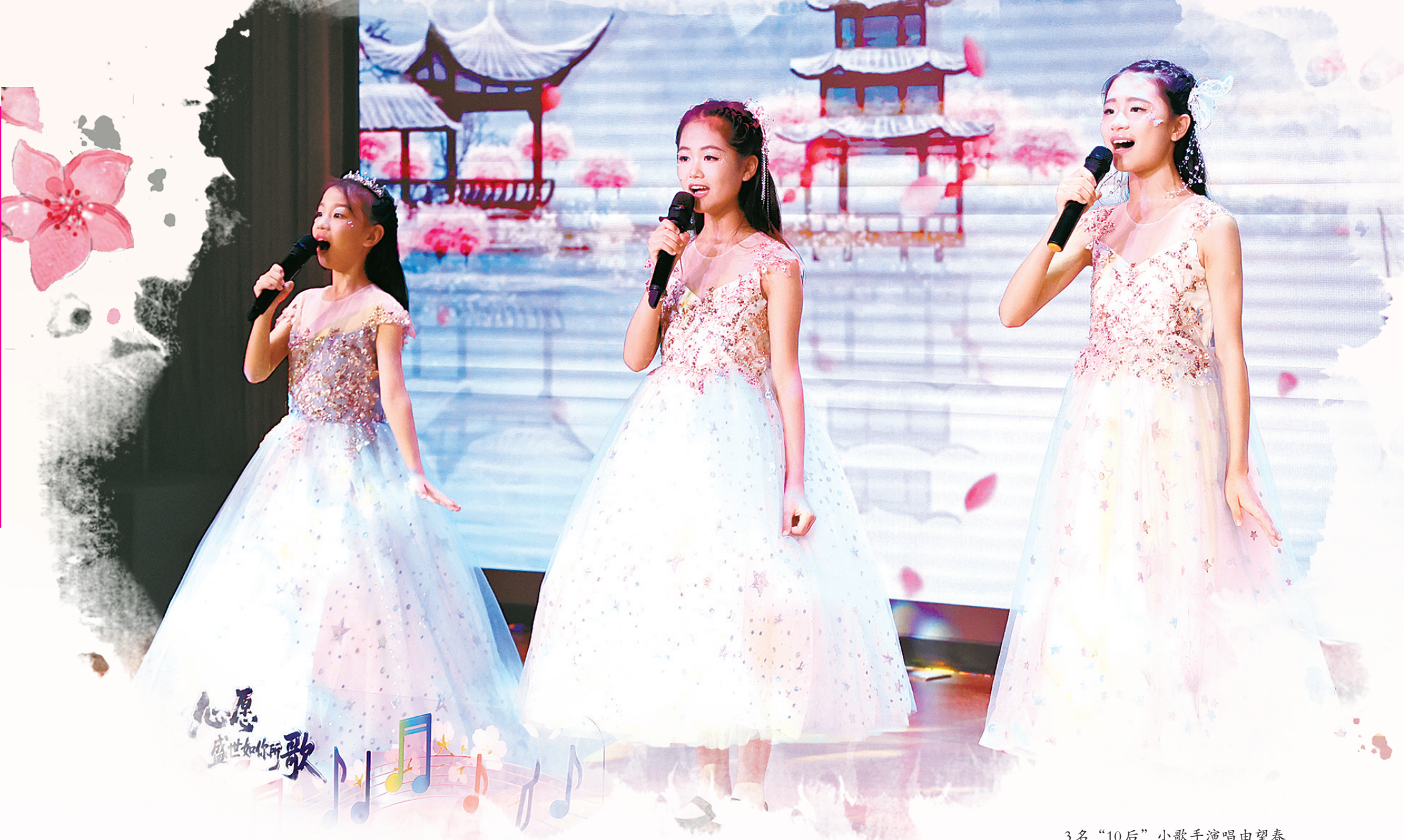
3名“10后”小歌手演唱由望泰街道“春芽计划”学员作曲的《重回桃花盛开的地方》。

“以‘桃花’为引，这场长达两个月的征集活动，让我们看到了音乐人对家国的赤诚热爱，看到了普通人对美好生活的热切向往。”两个月来，宁波大学音乐学院副教授沈浩杰把能动员的、有可能参与的宁波籍音乐家和音乐人都联系了一遍。“《桃花》之属既延续经典的质朴深情，又唱出当下的盛世气象；如今新作中，桃花是盛世，是心愿，也让我们看到了一座城市让‘心愿落地’的温暖底气。” 从一封悄然而至的书信，到一场影响范围及全球的征曲活动，再到一别开生面的故事音乐会……45年念念不忘，是因为“桃花”已然从个人心底的乡愁，升华为集体的精神符号，这里面藏着每个人的故事，藏着中国人不变的精神追求。 它开在每个人的心里，开在时代的土壤里，开在对美好生活永远的向往里。